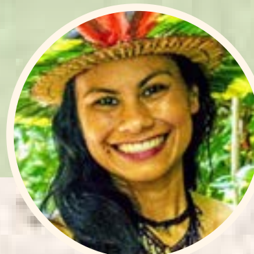
Escritora, geógrafa e intelectual indígena Márcia Kambeba